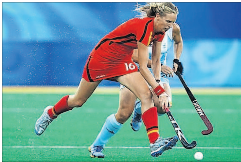
Idealbesetzung für Sportstadt Mannheim: Hockey-Olympiasiegerin Fanny Rinne.