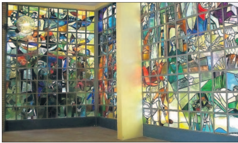
„Märchenfenster“ in der Johann-Peter-Hebel-Grundschule in Neustheim.

Ganz besonders freut die Organisatoren, dass sie, neben einem knappen Dutzend Familienmitgliedern Baer-