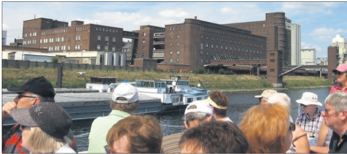
Der Verein RNK bietet zahlreiche Ausflüge an wie beispielsweise eine Bootstour zu den GEG-Fabriken.

Angeregt von Beispielen aus anderen Regionen wie dem Ruhrgebiet oder der Route der Industriekultur Rhein-Main haben sich zehn Leute aus der Gegend zusammengetan, um darzustellen, wie vielfältig Industrie-Kultur in der Metropolregion Rhein-Neckar ist. Es gibt viele außergewöhnliche bauliche, technische und künstlerische Sachzeugen der Industrie- und Sozialgeschichte in der Region, die ähnlich wie Kirchen, Schlösser und Burgen mehr oder weniger erhalten sind und ein ebenso wertvolles historisches Erbe darstellen. Dazu gehören Fabrikhallen, Elektrizitätswerke, Hafenanlagen, Industriemühlen, Werkssiedlungen, Direkto-